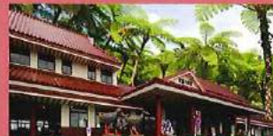
御菓子御殿 名護店 沖縄県名護市中山1024-1 TEL.0980-54-8515