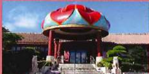
御菓子御殿 読谷本店 沖縄県読谷村宇座657-1 TEL.098-958-7333