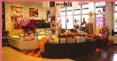
菓子工房 樹々 イオンタウン読谷店 沖縄県読谷村古堅740 イオンタウン読谷ショッピングセンター内 TEL.098-957-5550