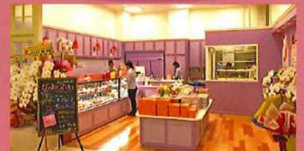
おかしのJolie Kiki(ジョリーキキ) 沖縄県読谷村大湾 343 サンエー大湾シティ内 TEL.098-956-6111