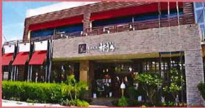
菓子工房 樹々 大木店 沖縄県読谷村大木459-7 TEL.098-956-3335