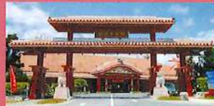
御菓子御殿 恩納店 沖縄県恩納村瀬良垣100 TEL.098-982-3388