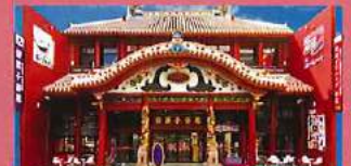
御菓子御殿 国際通り松尾店 沖縄県那覇市松尾1-2-5 TEL.098-862-0334