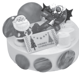
E.シトロン・ノエル [15cm] 3,333円 税込3,600円