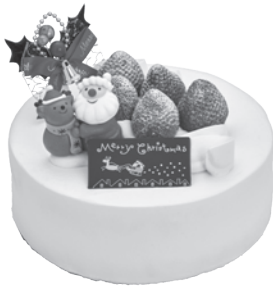
A.フレッシュクリームケーキ [15cm] 3,519円 税込3,800円 [18cm] 4,074円 税込4,400円