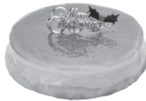
H.チーズケーキ [21cm] 2,778円 税込3,000円