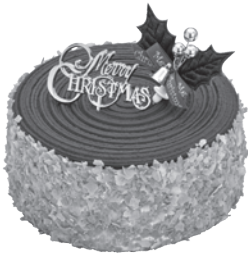
D.クリスマス・パープルルージュ [15cm] 2,778円 税込3,000円