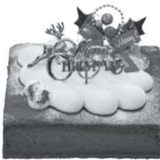
G.しっとりショコラ [15cm×15cm] 2,778円 税込3,000円