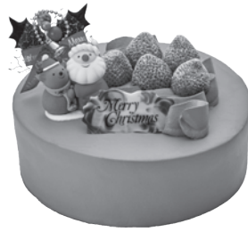
B.フレッシュチョコクリームケーキ [18cm] 4,074円 税込4,400円