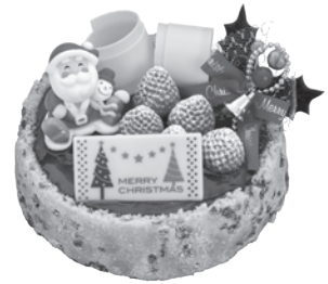
C.ベリーのレアチーズ [15cm] 3,333円 税込3,600円