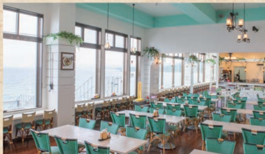
展望レストラン 美ら海▶